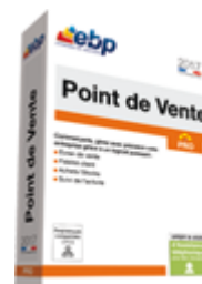
EBP Point de Vente PRO 2017 Gammes