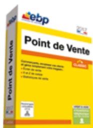
EBP Point de Vente Classic 2017

Comparez et choisissez votre logiciel point de vente